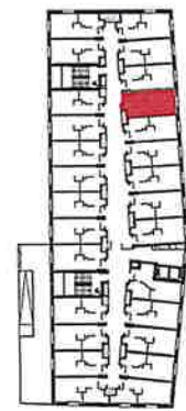
Rue de la Falencerie